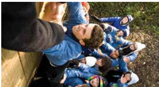
RYLA-evenemang förmedlar värderingar om hjälpande och ledarskap från tidig ålder.

Interact- och Rotaractklubbar sponsras av närliggande Rotaryklubbar. Hör med ledarna i din klubb hur du kan engagera dig om du skulle vilja arbeta med lokala Interact- och Rotaractklubbar.